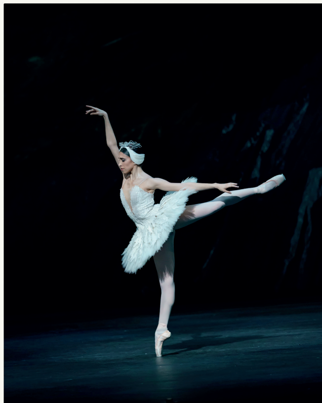
Yasmine Naghdi nel ruolo di Odette in Il Lago dei Cigni, The Royal Ballet