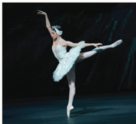
Yasmine Naghdi nel ruolo di Odette in Il Lago dei Cigni, The Royal Ballet